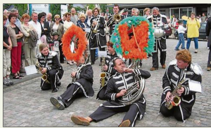
Auch nach dem Festzug immer gern gesehen: „Tis Niks wut niks“.

ihr breit gefächertes Repertoire, das von Schlagnern und Evergreens über aktuelle Charthits bis zur Party- und Rockmusik alles enthält, was die Gäste am Schützenfestmontag lieben. (r)