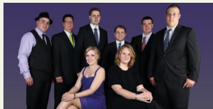
Neue Gesichter in Usseln: die Gruppe „Querbeat“.

mannszug Mühlhausen, die Schützenblaskapelle Willingen und der Musikverein Düdinghausen geben beim Festzug und danach den Ton an. Auch viele Schützenkameraden geben sich die Ehre: Die Korbacher, Willinger, Bömighäuser, Schwalefelder und Neerdarer marschieren mit den Usselnern. (r/wf)