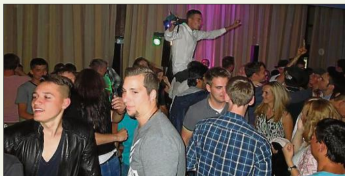
Gelassen feiern im Diemelsaal: die Club-Lounge.