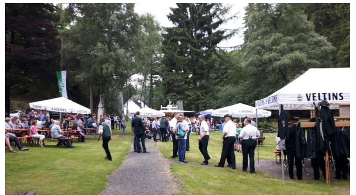
Das Schießen ist gut besucht.