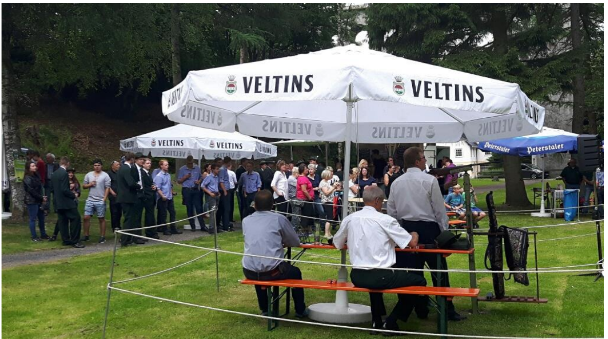
Das Schießen kann beginnen.