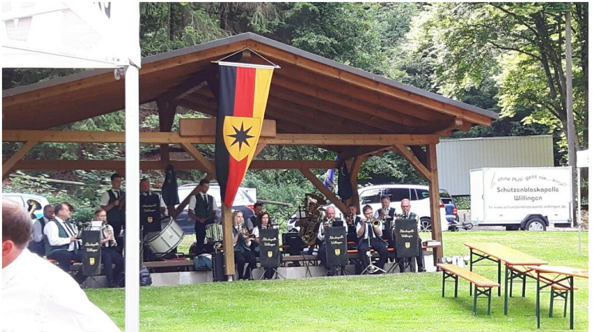
Die Willinger Schützenblaskapelle sorgt für die musikalische Unterhaltung.