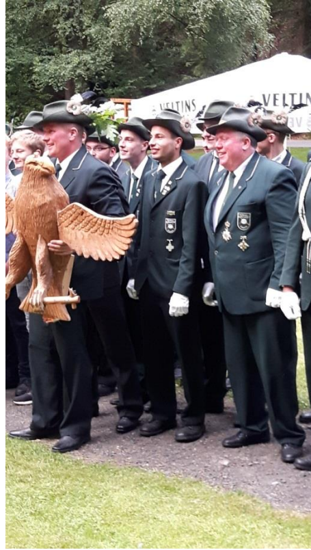
Ab 20.45 Uhr gibt's Freibier.