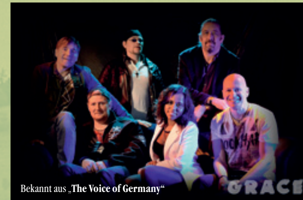
Bekannt aus „The Voice of Germany“

Eine neue Musik gibt ihre Visitenkarte im Upland ab. Grace ist eine Formation, die insbesondere die jeweils aktuellen Top40 Charts perfekt interpretiert. Mit Sbari haben sie zudem eine aus der Sendung „The Voice of Germany“ bekannte Sängerin in ihren Reihen. Die sechs Musiker aus dem Großraum Hannover werden aber auch alle anderen Musikrichtungen von Tanz- und Schlager- bis Rockmusik präsentieren.